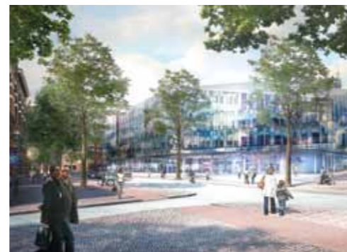
Artist Impression definitief ontwerp van Mecanoo gezien vanaf de Coenderstraat

Wilt u meer weten over het nieuwe stadskantoor, dan kunt u contact opnemen met: Informatiecentrum Delft Bouwt, Barbarasteeg 2, woensdag tot en met vrijdag geopend van 11.00 tot 18.00 uur. Zaterdag van 11.00 tot 17.00 uur. Tijdens kantooruren bereikbaar op telefoonnummer 015 260 26 11. Mail: spoorzone@delft.nl Op www.spoorzonedelft.nl vindt u altijd de meest actuele informatie over het project.