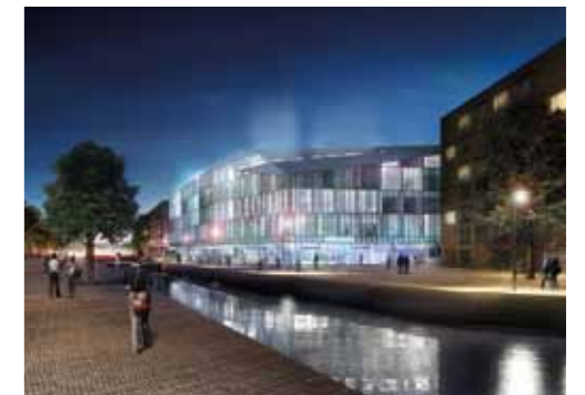
Artist Impression voorlopig ontwerp van Mecanoo gezien vanaf het Bolwerk 's avonds

Het gebouw is ontworpen door Mecanoo Architecten uit Delft. Mecanoo heeft gekozen voor een gebouw dat een uitstraling heeft aan alle kanten. De verlaagde daklijnen op de hoeken zorgen voor een geleidelijke overgang naar de bestaande bebouwing. Binnen de grenzen van het bestemmingsplan heeft het ontwerp een zo gunstig mogelijke verhouding tussen vloer- en geveloppervlak.