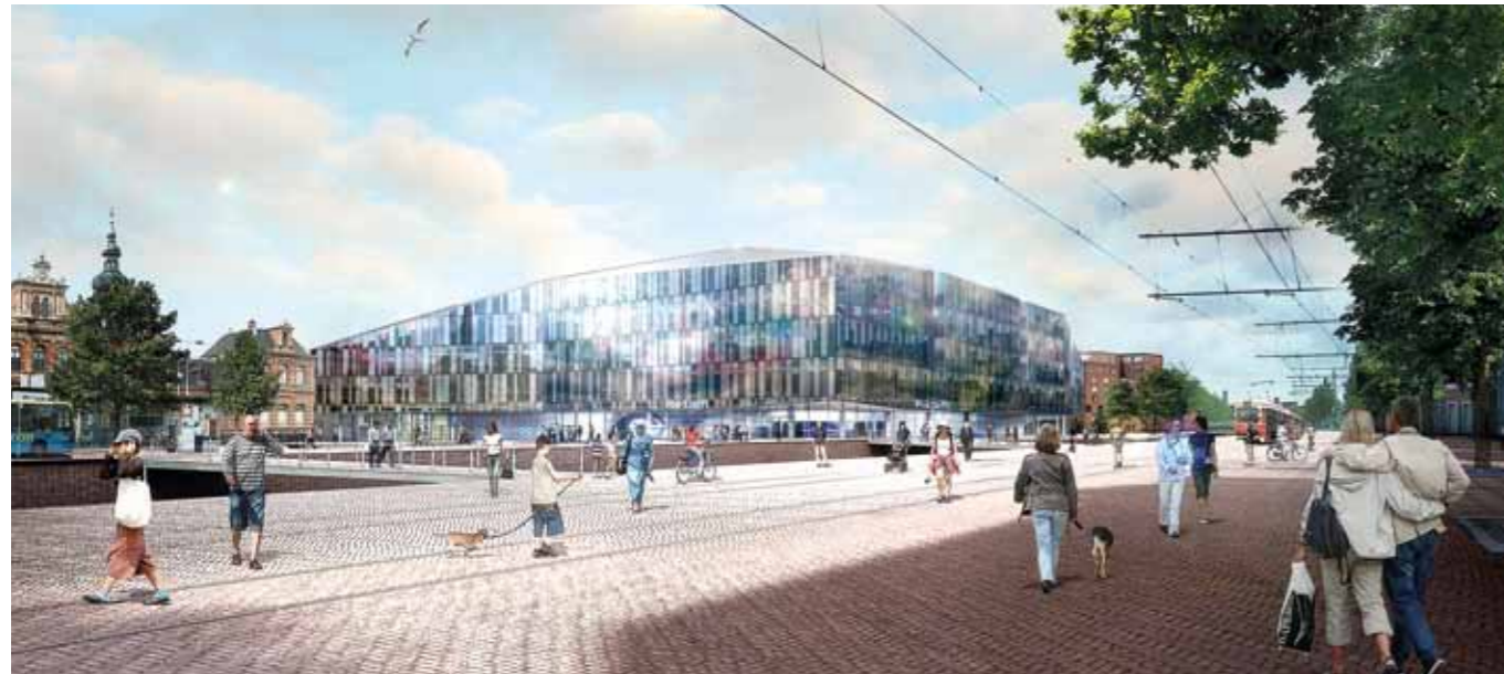
Artist Impression definitief ontwerp van Mecanoo gezien vanaf de Westvest