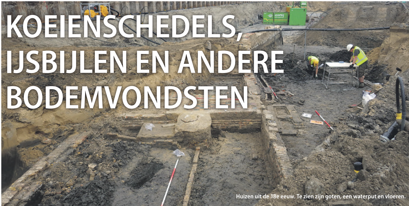
Huizen uit de 18e eeuw. Te zien zijn goten, een waterput en vloeren.